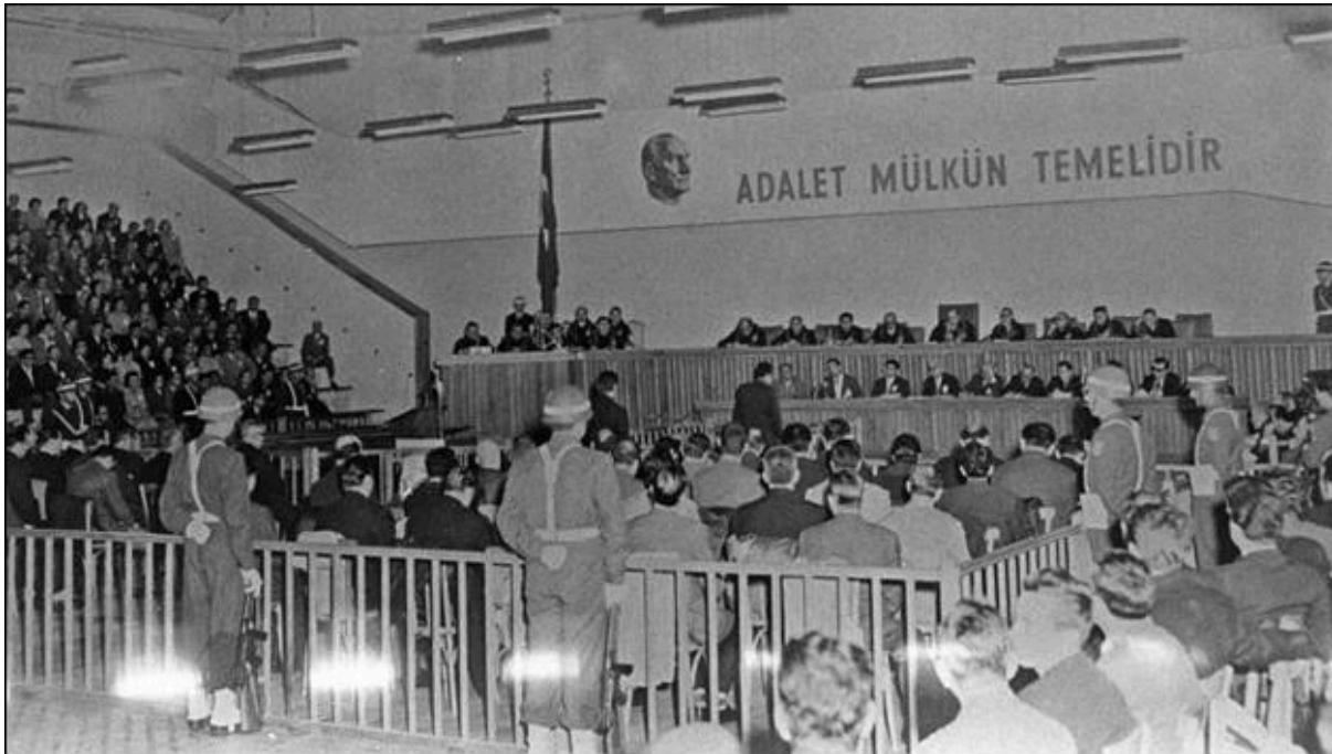
1.0. Darbenin Ağır Bilançosu (12 Eylül Darbesinin Resmi ve Hukuki Bilançosu )

Askerler durduk yere evlere girip her yeri darmadağın ederek yasaklı kitapları, filmleri veya siyasi saydıkları sembolleri arıyorlardı. Bulurlarsa sorgusuz sualsiz tutukluyor, bulamazlarsa sakladıkları iddia edilerek halka şiddet uyguluyorlardı. Aslında kurtarıcı zannedilen asker halka zulmediyordu. Köylerde jandarmalar şehirlerde TSK askerleri sürekli evleri ve dükkanları basıyordu. Bu sebebe toplum korkuyor ve kendilerinde bulunacak herhangi bir kusuru engellemek adına yıllardır sakladıkları fotoğrafları yakıyor veyahut yıllardır alışkanlıklar uzattıkları bıyıklarını, saçlarını kesiyorlardı. Bazı renkler, bazı kıyafetler bile ordu tarafından mimleniyordu. Hal böyle olunca halk zulüm görmemek için Kenan Evren'e ve orduya güzel görünmeye çalışıyor, onlara saygıda kusur etmiyorlardı. Evlere ve dükkanlara asılmak üzere Kenan Evren'in tablolu fotoğrafları satılmaya başlandı. Bu olaylar günümüze komedi-dram dizileri olarak yansımıştır. Bunlardan biri de TRT yapımı olan 80'ler dizisidir. Dizide o yıllarda yaşanan olaylar İstanbulun küçük bir mahallesinde anlatılmakta ve darbenin halka yansıyan görüntüsünü yansıtılmaktadır.